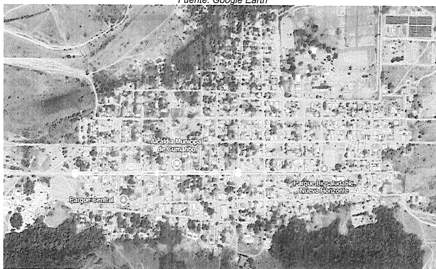
Figura 2 Localización específica de las vías a pavimentar